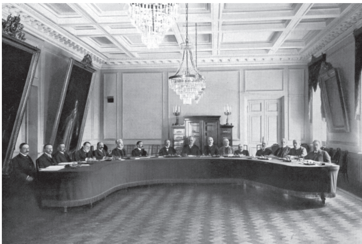
Совет Государственного банка. Фото. 1909 г.