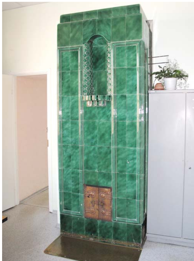
Печи, облицованные цветными изразцами

Особого внимания заслуживают печи, облицованные цветными изразцами, сохранившие свою красоту спустя столетие и такие непохожие друг на друга. Всего в здании сохранились и функционируют 13 изразцовых печей, отличающихся друг от друга по цвету и элементам.