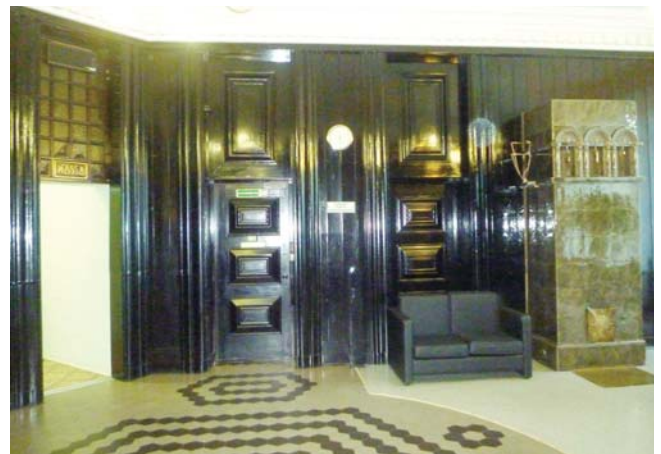
Холл здания РКЦ Сортвала