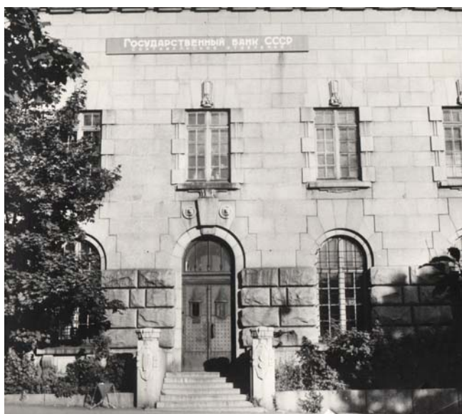
Здание Сортавальского отделения Госбанка СССР

Приданию празднику исторического акцента способствовала временная выставка экспонатов музейно-экспозиционного фонда Отделения – НБ Республика Карелия, представленная образцами формы банковских служащих и счетной техники, архивными документами, памятными банкнотами и монетой, выпущенными Бан-