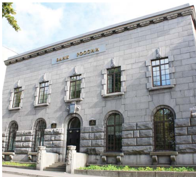
Здание РКЦ Сортавала в настоящее время