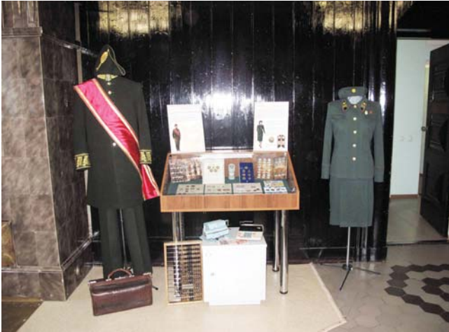
Временная выставка экспонатов музейно-экспозиционного фонда Отделения-НБ Республика Карелия

ком России. В ходе экскурсии по зданию гости имели возможность своими глазами увидеть всю красоту и величественность внешней отделки и внутреннего убранства помещений.