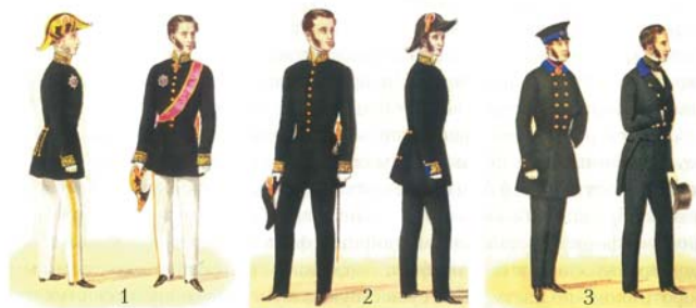
1. Парадный мундир 4-го разряда чиновников Министерства финансов (по закону 1856 г.) 2. Парадный мундир 5-го и 6-го разрядов чиновников Министерства финансов (по закону 1856 г.) 3. Будничная форма чиновников Министерства финансов (по закону 1856 г.)

4 июля 1861 года императором Александром II было утверждено «Расписание должностей Государственного банка» (штатное расписание), в котором были определены должности, соответствовавшие им оклады,